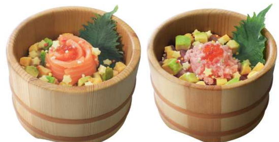
サーモンとチーズおひつごはん

https://www.aeoneaheart.co.jp/special/dollsfest/